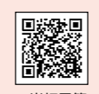
▲当初予算の詳細はこちら