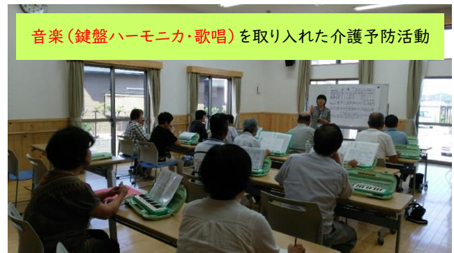
音楽（鍵盤ハーモニカ・歌唱）を取り入れた介護予防活動