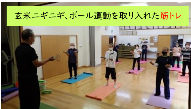
玄米ニギニギ、ボール運動を取り入れた筋トレ