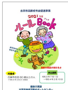
公民館等の活動に参加してシールをもらおう