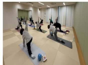
「股関節と背骨の調律」 フミフミコミュニティ