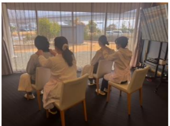
「セラピューティック・ケア」