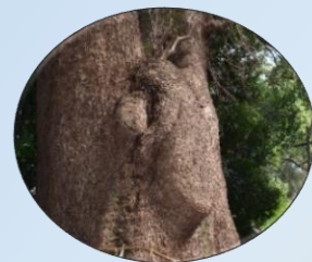
ムーミンの木(五所八幡宮境内)