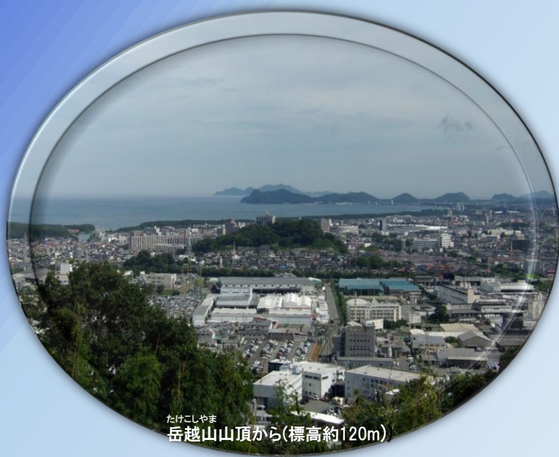
たけこしやま 岳越山山頂から(標高約120m)