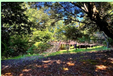
どんぐりの森のデッキ