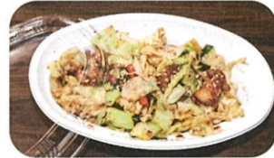
野菜たっぷりホルモン鉄板焼 (テイクアウト)

定食で鶏すき定食をいただけま す。またテイクアウトも数多くの メニューが取り揃えられています。 ぜひお立ち寄りください。