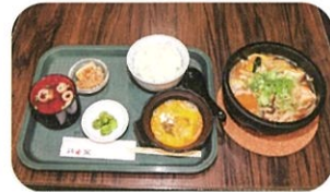
鶏すき定食(ランチメニュー)