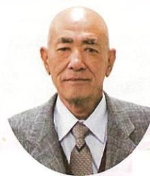
古賀市農業委員会会長