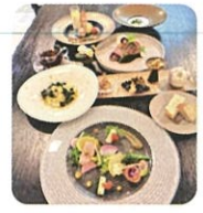
ステーキコース 3,500円(税込)