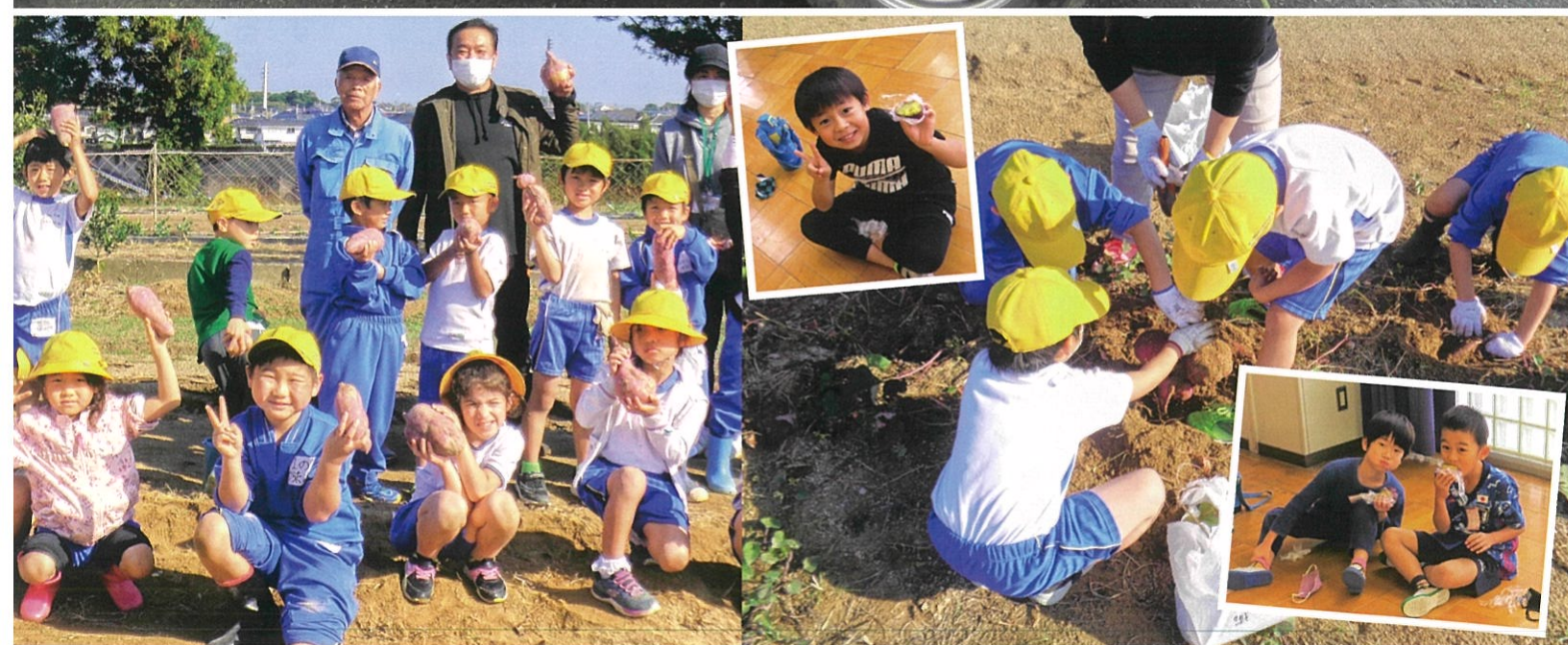
写真上：2年ぶりに開催された、農家直売！軽トラ市。農業委員会からは鉢物・観葉植物などを出店しました。 写真下：舞の里小学校1年生による芋掘り体験・収穫祭の風景です。