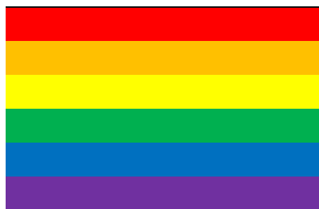
◆レインボーフラッグ

本ガイドラインが、今まであたりまえのように考えられてきた認識や習慣を見直し、性的指向・性自認に対する偏見や差別につながるものがないか考えるきっかけとなるとともに、誰もが自分の自認する性を尊重され、自分らしく生きられる社会となるため、活用いただきますようお願いいたします。