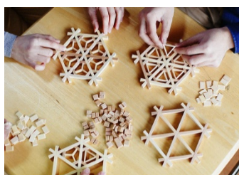
“体験”をフックとした 物販での海外展開