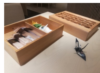
国内ホテルのウェルカム アメニティ菓子茶箱として