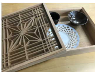
高価格帯の海外レストランへ 食器+ケースとして