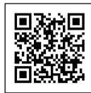
乗り方・降り方編