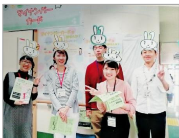
マイナンバーカードのPR をしました。 （健康福祉まつり）

仕事は楽なことばかりではありませんが、私のふるさと古賀市です。育ててくれた人や、過ごしてきた場所に関わることにやりがいを感じながら働いています。もちろん、古賀市以外が出身の職員も多く、みなさん熱い人ばかりです。就職活動では、これでいいのかと不安になることもあると思いますが、みなさんらしく臨んでください。一緒に働けることを楽しみにしています！