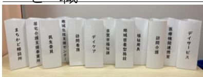
▲福岡聖恵病院の最優秀賞に選ばれた作品

作り「コガイチ」として活動をしています。昨年 10 月に民生委員さんや看護学生さんにも呼び掛けて、ロールプレイ研修を行いました。いつも電話でやり取りをしますが、電話を使わず直接会って話しを詰めていきます。利用者役の学生さんにもわかりやすく説明をしたり、多職種とスムーズに連携をして日頃のお仕事を発揮して頂きました。専門職の方は自身の振り返りができ、地域の方は相談先を知ることができ、学生さんは教科書で学んでいることが目に見えて確認できた研修になりました。今後も手を取り合って、地域の支援ができるよう努めていきたいと思えます。