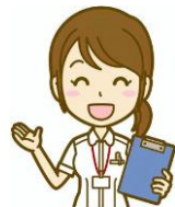
保健師または看護師