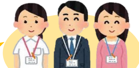
保健師 社会福祉士 ケア マネジャー