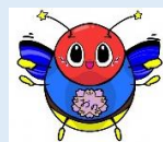
小野小マスコットキャラクター「おのっこ ほたりん」