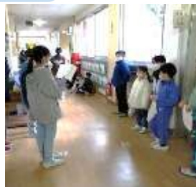
【高学年が出欠確認】