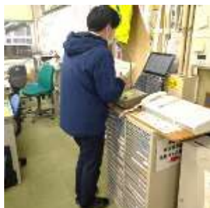
【かえる会発動の放送】

特に高学年の動きが素晴らしく、自分たちの力でグループ(12個あります)を安全に確実に集合させようと、率先して動く姿があちこちで見られました。