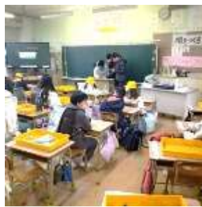
【かえる会グループ毎に順に速やかに下校】