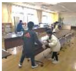
【気働きをしつつ掃除】

6年生を中心に掃除場所の確認、掃除のアドバイス、そしてふり返りを行います。低学年は上級生が教えてくれるので、いつもより頑張る姿が見られます。一方高学年も、後輩の手本になるべく、きびきび行動しています。