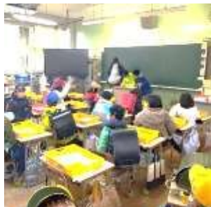
【高学年が率先した出欠をとります】