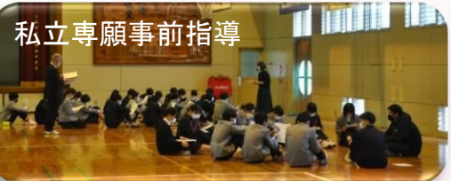
私立専願事前指導