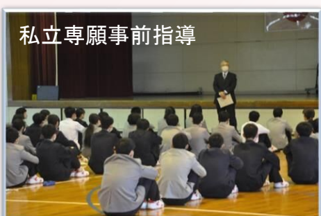
私立専願事前指導

1月に入って入学検査が随時行なわれています。保護者の方の世代と違って、現在は様々な形で入学検査が行なわれています。また、古賀市は地理的に北九州地区の高等学校も通学圏内であることから、志望校の選択肢が広がります。それだけチャンスがあるということに