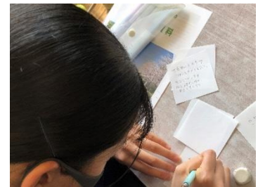
【平和への願いを折り紙に書いている様子】

2年生は、3月25日(木)からの修学旅行に向けて、調べ学習や平和学習などの事前学習を行っています。修学旅行の見学先の一つとして「知覧特攻平和会館」を予定しています。先日、この知覧での特別攻撃隊について学習しました。生徒たちは、多くの特攻隊員が出撃し亡くなった歴史を知り、戦争の悲惨さ、命の尊さ、平和の大切さ、平和を守るために自分たちに何ができるかについて深く考えました。そして、平和への願いをしたためた折り紙を用いて、心を込めて鶴を折りました。この2年生一人ひとりの平和への思いが込められた鶴で千羽鶴を作り、修学旅行で「知覧特攻平和会館」へ寄贈する予定です。