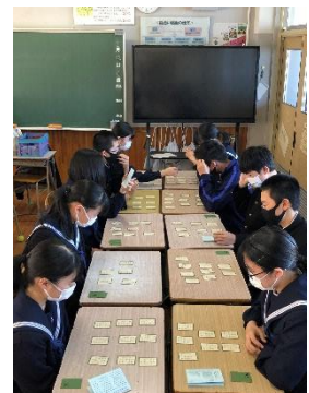
【百人一首の練習の様子】

1・2年生は、3月中旬に百人一首大会を予定しています。国語の授業で百人一首について学び、対戦練習を行っています。また、昼休みや放課後を使って自主的に練習している学級も出てきました。生徒たちは、チームに貢献するために、一生懸命覚えようと取り組んでいます。大会では、学習の成果を発揮してくれることを期待しています。