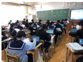
【パソコンをひとりずつ操作】

今後、ICT教育をますます充実させ、生徒一人ひとりを大切にしたいと思っております。