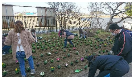
【花壇の花植えの様子】