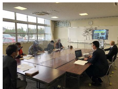
【PTCA学校運営協議会の様子】

来年度は、現在のコロナ禍の状況が落ち着き、地域・家庭・学校が協働した教育活動を充実できることを願っています。