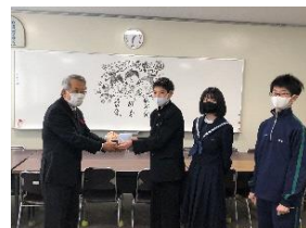
【福祉協議会の方に渡しました】

1月に生徒会中央委員会で取り組んだ「赤い羽根共同募金」で集まった16,451円を古賀市社会福祉協議会の方にお渡ししました。協議会の方から「たくさんの募金をありがとうございます。福祉コミュニティづくりに役立てます」と感謝の言葉をいただきました。古賀中生のあたたかい思いが、安心して暮らすことができる古賀市の地域福祉づくりに役立てられることをうれしく思います。