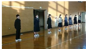
【集会指導の練習の様子】

生徒会認証式を終え、生徒会が正式に発足しました。12月22日(火)から25日(金)までリーダー研修ウィークとして、生徒会役員としての心構えや原案の作成方法、集会指導の方法などを学びました。リーダー研修会に臨む真剣な姿勢に、これまで3年生が築いてきたよき伝統を継承しつつ、新しい風も吹き込んでくれる期待がもてます。これからの古賀中学校生徒会に注目していただきたいと思います。