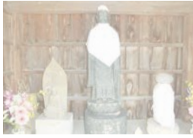
おだけじそうどう 小竹地藏堂(くぎ抜き地藏) E