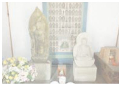
おだけやくしどう 小竹薬師堂 D

11月25日に行われるお祭り。いになめ祭とも、お座ともいわれる。この時期には珍しく、お雑煮が振舞われる。