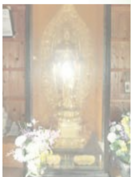
さぶらうてんじんしゃ 三郎天神社 B

糟屋北部新四国八十八箇所霊場の49番札所の小竹観音堂は、釈迦如来が御本尊として安置されている。観音堂ということで黄金に輝く立派な千手観世音菩薩が安置されており、1532年に桧木一本造りで制作され、1624年に観音堂が建設されて1883年に修復工事が行われている。また、地藏菩薩は1716年に奉納された経緯があり、現御本尊(釈迦如来)は、平成元年10月に奉納されている。