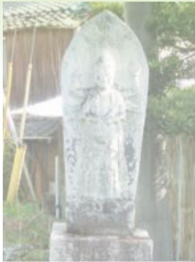
しょうめんこんこう 青面金剛 C

小竹の超有名人。甘薯(さつまいも)栽培の研究家。徳永式甘薯栽培法(かぶらうえ)を生み出し、指導・普及に努める。当時は視察もかなり多かったらしい。