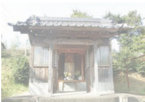
おだけかんのんどう 小竹観音堂 A

糟屋北部新四国八十八箇所霊場の49番札所の小竹観音堂は、釈迦如来が御本尊として安置されている。観音堂ということで黄金に輝く立派な千手観世音菩薩が安置されており、1532年に桧木一本造りで制作され、1624年に観音堂が建設されて1883年に修復工事が行われている。また、地藏菩薩は1716年に奉納された経緯があり、現御本尊(釈迦如来)は、平成元年10月に奉納されている。