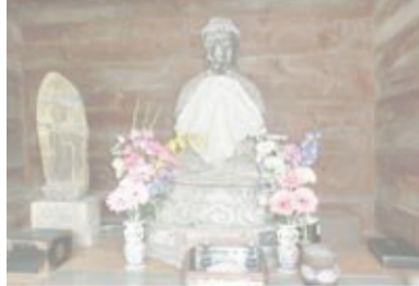
おだけじゅういちめんかんのんどう 小竹十一面観音堂 F