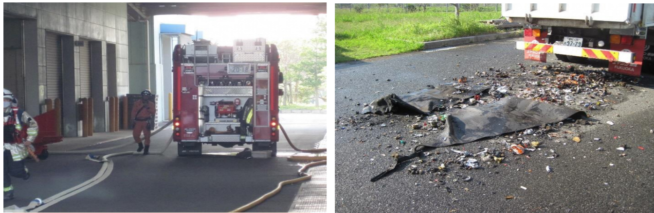
焼損したゴム製の防塵スカート