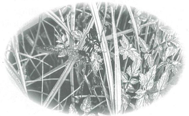
▲羽化したばかりのトンボに出会えてラッキー