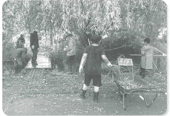
▲子ども達 がんばる

ぼうぼう生えていた土手の草刈り、ビオトープのヘドロ掻きと、みんなで手分けして作業はどんどんはかどりました。1時間ほどしてビオトープはすっきりきれいになりました。