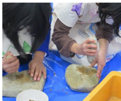
どんぐりをすりつぶす体験

どんぐりクッキーを焼いている間に「火おこし」「石器で切る」「どんぐりをすりつぶす」の3つの体験を実施した。時間が少なく1つの体験が5分ほどだったので、もっとやりたかったとの感想が聞かれた。「火おこし」体験は、火気厳禁の為、本格的に火をおこすことはできないことを残念がっていた。