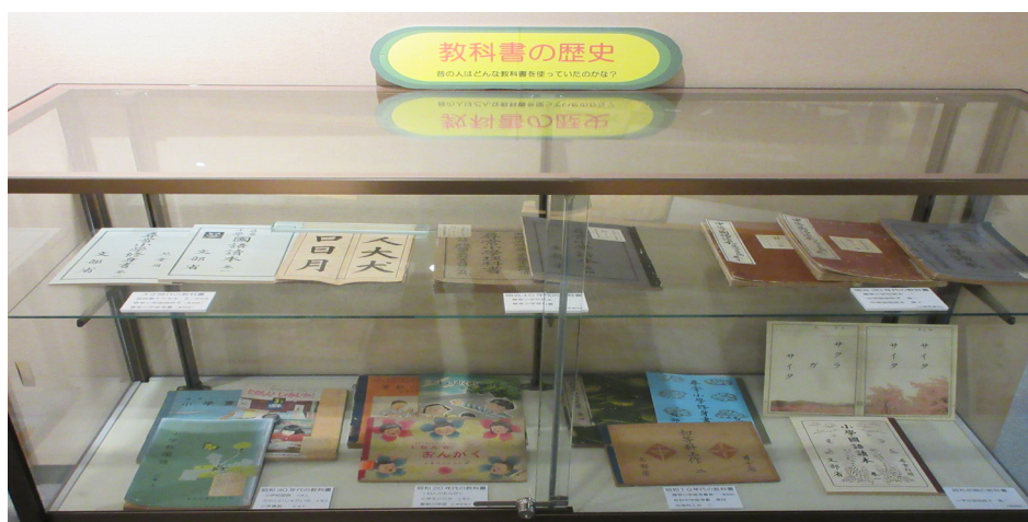
古賀市内の小学校の歩みの紹介と、寄贈いただいた昔の教科書を展示している