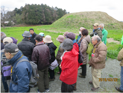
説明を受けながら新原・奴山古墳群を散策