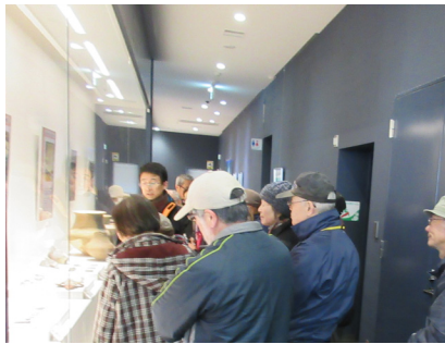
カメラステージ歴史資料館内を見学