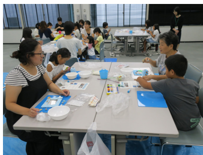
【制作】紙粘土と貝殻やシーグラスを使ってデコレーション