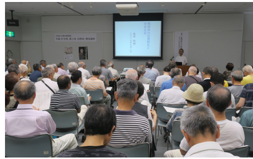
熱心に話を聞く参加者