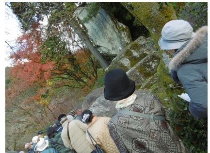
腹切り岩：秋月種実の重臣惠利幡堯が、天正15年豊臣秀吉の九州征伐の折、秋月氏に勝ち目がないことを訴えるが聞き入れられず、この岩の上で自刃して訴えた。