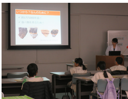
映像を使った講話