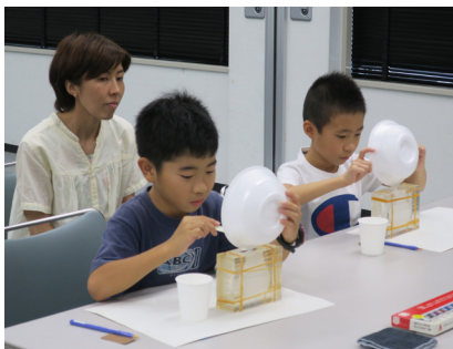
型に石膏を流し込む

歴史に興味のある子どもたちが集まったため、大変意欲的な活動をすることができた。船原古墳への知識とともに、大昔の古賀市にも有力者がいたことを学んだことで、古賀市の歴史への関心も高まったと考える。これからも歴史資料館に足を運んでくれることを期待したい。