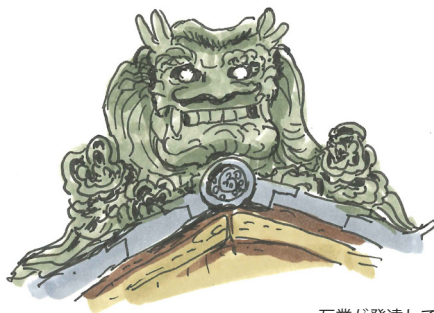
瓦業が発達していた古賀の鬼瓦