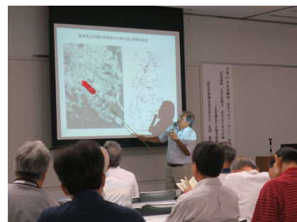
【講演】防衛庁で公開された最新情報をもとに、玄海灘沿岸の戦争遺跡についての講演