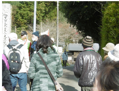
大涼寺の門：黒田長興が母親（黒田長政の正室で、徳川家から興入れた）の3回忌に建立した寺。御堂内の内幕には徳川家の葵の御紋が残されていた。