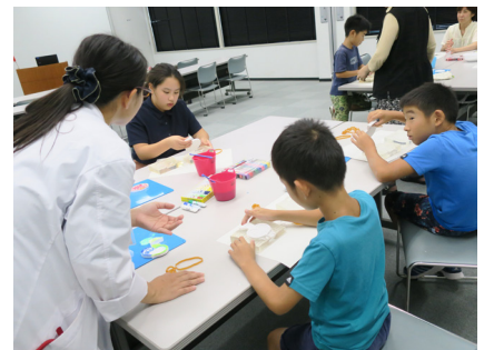
石膏を型からぬく