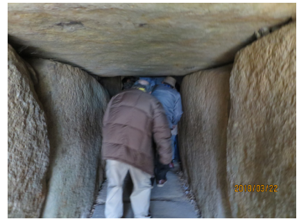
手光波切不動古墳の石室内部を見学