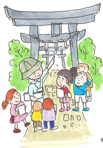
熊野神社で現地学習