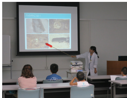
古賀の歴史と船原古墳出土遺物についての話を聞く