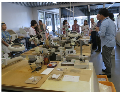
バックヤードで最新機器を使った調査の様子を見学