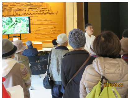
神宝館で神職の方の話を受ける参加者