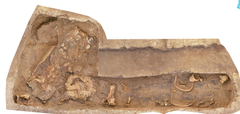
▲お宝ざくざく♪1号土坑