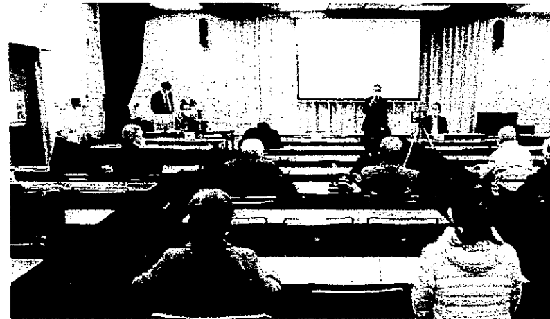
「報告と対話のつどい」(2022年1月30日)