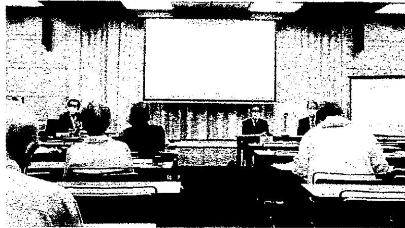
「報告と対話のつどい」(2021年11月14日)