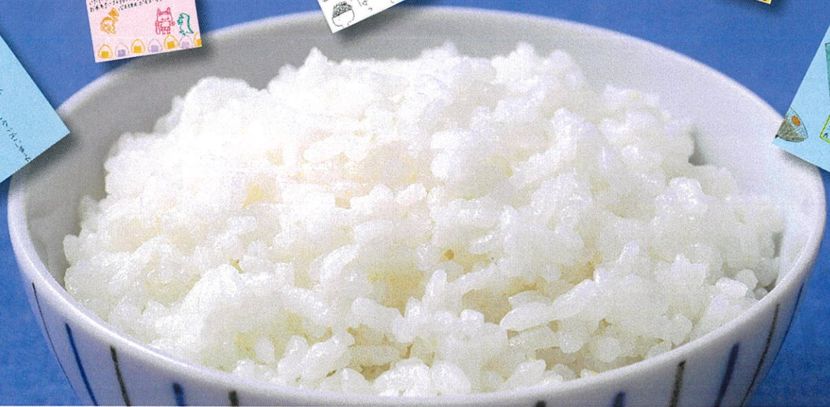
新型コロナウイルス感染症対策として行った子どもたちへのお米の寄附に対して、たくさんのお礼のはがきをいただきました。