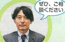
ぜひ、ご相談ください

お問い合わせ 農業者年金の内容やご相談は、市農業委員会、最寄りのJA または農業者年金基金にお問い合わせください。 独立行政法人 農業者年金基金 ☎03-3502-3199