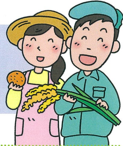
古賀市農業者年金加入推進部長：長崎

◆詳しい内容については、下記にお問い合わせください。市農業委員会 また、機構のホームページでも手続きについてご覧いただけます。 ・古賀市農林振興課 ☎942-1120 https://www.city.koga.fukuoka.jp/cityhall/work/nourin/iinkai/ ・(公財)福岡県農業振興推進機構(農地中間管理機構) ☎716-8355 https://www.f-ap.org/