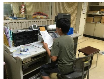
【委員会：放送委員会の活動】

ご家庭におきましてもコロナ対策に加えて、バランスのよい食事、十分な睡眠をとるように気をつけていただき元気でこの暑さを乗り切れるようご協力をよろしくお願いします。