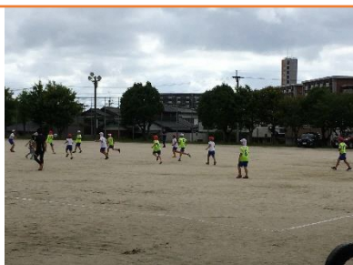
【クラブ活動：サッカークラブ】