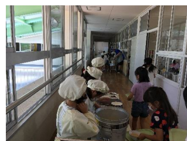
【児童が給仕する給食準備】