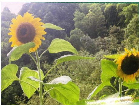
【老夫婦が育てたひまわりの花】

昨年11月4日に種が届いたときに一度電話で連絡をくださっていた方からの手紙でした。種をまいて大切に育て、ひまわりの写真まで撮って送ってくださったのです。お手紙の中には、ひまわりの種が届いた驚きと喜び、そして、「夫婦にロマンを与えてもらって『ありがとう！！』とまつおかくんにお伝えください。」と書いてありました。3年生の総合的な学習で行った活動は、こうやって山口県