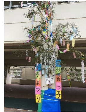
【たんぽぽ：七夕祭りの笹】

今後も、楽しい行事や活動を、感染防止対策をしながらなるべく実施できるようにしていきたいと思えます。