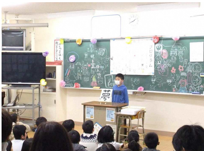
2年生 生活科 自分はっけんはっぴょう会

1月25日(土)に行いました学習参観・懇談会に多数ご参加いただき、ありがとうございました。