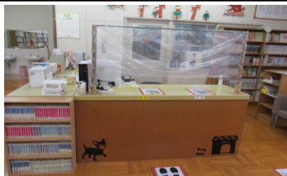
(図書室のカウンター)