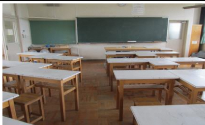
(美術室は間をあけて着席)