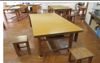
(技術室は座る位置を工夫)