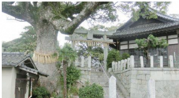
綿津見神社(わたつみじんじや) A

荘園の荘の字が変化して「庄」になったといわれる肥沃な大農園地帯。起源は平安時代末期の源平合戦の頃合までさかのぼり、この集落の人たちは、おそらく東北地域から流れて来たのではないかと考えられている。川の無いこの集落は、中心にある綿津見神社が、水にまつわる神様なのもうなづける。この地域を歩いてみると、至る所に子ども達の笑い声や、走り回っている姿が思い描ける。