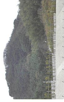
F 青柳尋常高等小学校跡

五所八幡宮で、毎年7月31日18時半から輪越し神事が行われ、無病息災を祈って直径2メートル以上の輪をくぐってお参りします。400年余り続く伝統的な祭りで、参道の両脇には300本を超える竹筒にろうそくの火が灯され、幻想的な雰囲気をかもし出します。お参りを終えた参拝客は、くぐった輪の茅(ちかや)を1本抜いて持ち帰り、先端をくると結んで魔除けとして玄関に飾ります。古賀神社や小山田斎宮などでも行われている。