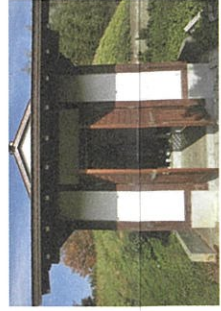
B 勘慶さまの墓碑(野田若狭の墓)

市指定文化財。宗像氏貞の実妹。宗像(毛利方)と立花(大友方)の戦いで和睦した宗像氏貞が、人質として立花道雪に送ったといわれ、後に道雪の側室となる。ときに色姫25歳、道雪57歳。色姫は身体が弱く、肌は色白で透き通るほどだったといわれている。1584年3月24日(享年39歳)病歿。自殺・心中により亡くなったとの説があるが、色姫にまつわる話は数多くある。