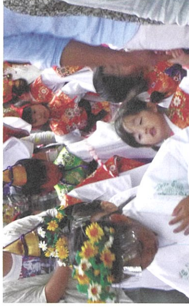
あおやぎほうしゅうえ 青柳放生会

市指定文化財。青柳の寺浦の大日堂に祀られ、頭部と軀内に墨書銘があり、文明7年(1475年:室町時代)など文字が残されている。造立から500年以上もたった今日、このような上品で宮廷風の仏像を拝することが出来るのは、数回にわたり修理・修復が行われてきたからで、いかにこの地が長い間、厚い信仰心とともに生きてきたかが伺える。9代目運慶の作とも、9代目運慶の弟子の作とも、双方の合作とも考えられるが、真実はまだ定かではない。