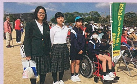
<千鳥校区コミュニティ自主防災訓練の様子>