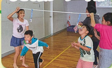
子ども会リーダー事業