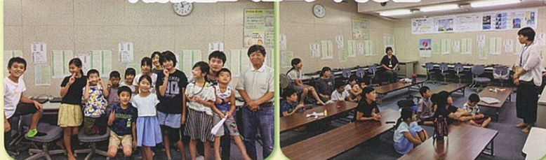
千鳥校区コミュニティ寺子屋