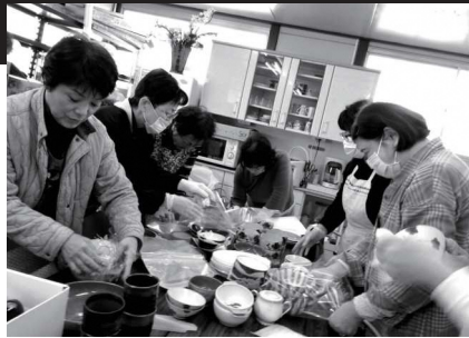
▲まつり古賀の事前準備

みなさん、手際よく作業をしていただきました。たいへん助かりました。 高校生も大きな声を出して呼びかけてくれてお店全体が活気づきました。