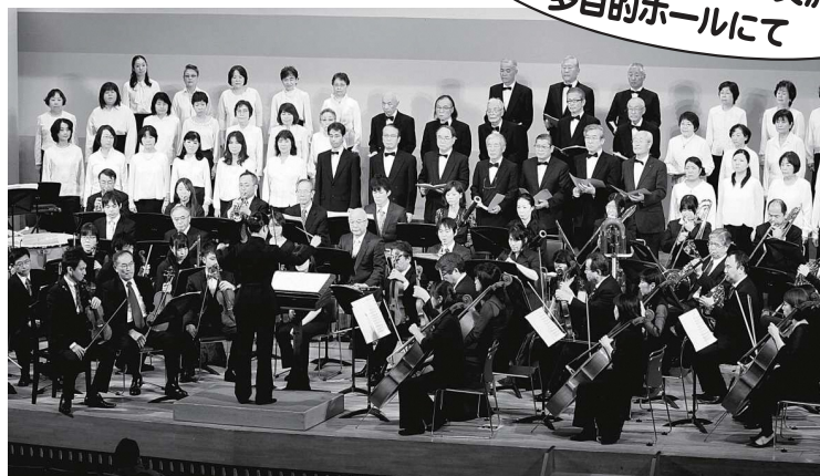
▲古賀市「第九」実行委員会と古賀市民オーケストラのコラボコンサート