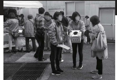
▲まつり古賀での寄付呼びかけ