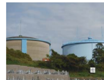
④ 筥内医王寺配水池