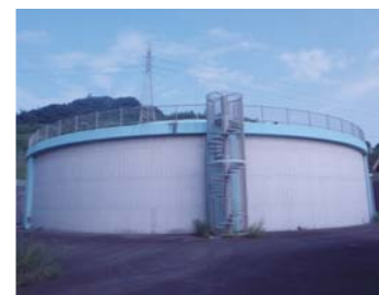
③ 立花第二配水池(新宮町)