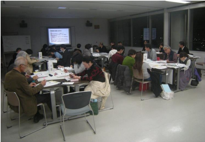
第10回策定委員会の様子

現在、公募市民等による「古賀市自治基本条例（仮称）策定委員会」が中心となって条例に盛り込む内容を検討しています。