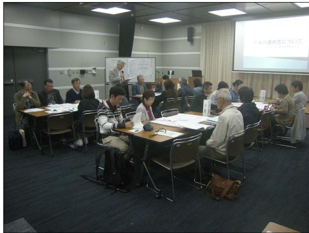
第9回策定委員会の様子

現在、公募市民等による「古賀市自治基本条例（仮称）策定委員会」が中心となって条例に盛り込む内容を検討しています。