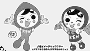
図 図書館のもよおし

■日時 6月6日(月) 10時~15時 ■場所 人権センターWith(ウィズ) 家庭内のもめごと、近所トラブル、いじめ、行政への意見・要望などの悩みごと相談に応じています。 ④⑤ 問 人権センターWith(ウィズ) ☎942-1128