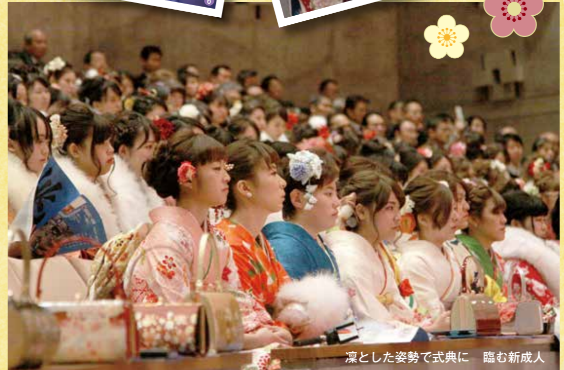
凛とした姿勢で式典に臨む新成人