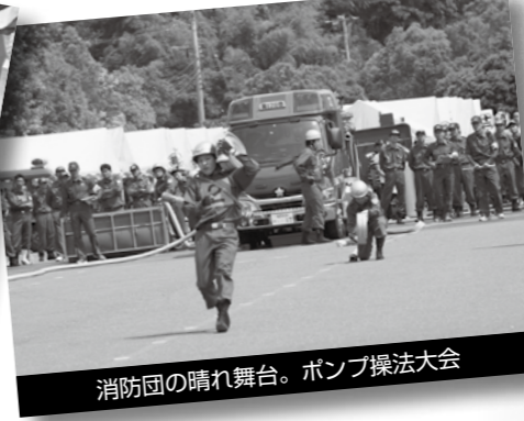
消防団の晴れ舞台。ポンプ操法大会