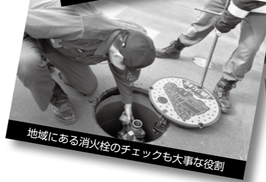
地域にある消火栓のチェックも大事な役割