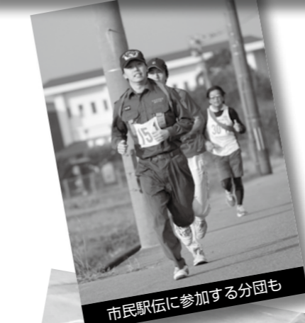
市民駅伝に参加する分団も