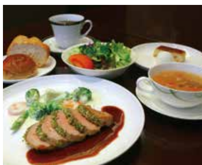
写真はポークヒレ肉のポワレ(はちみつ風味) ※日によって内容は変わります。