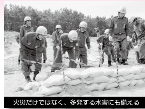
火災だけではなく、多発する水害にも備える

これから女性消防団員として活動していく中で、多くの人たちと出会う機会があるかと思いますが、取り柄である笑顔と元気を活かして、地域の皆さんに親しまれる団員をめざしてがんばっていききたいと思います。