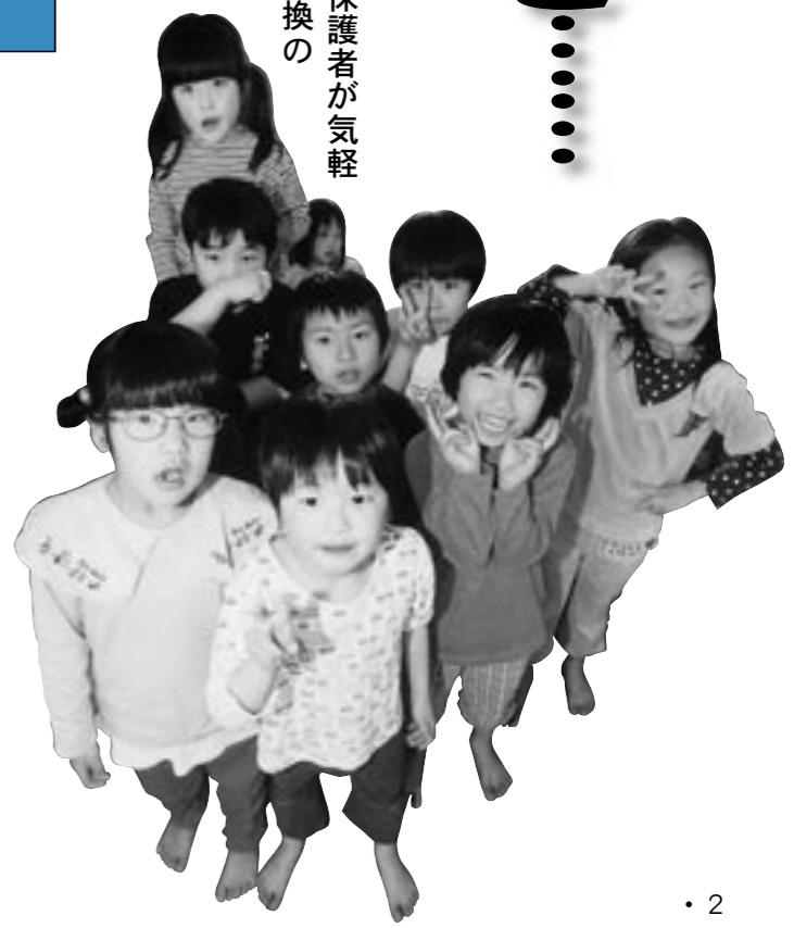
▶撮影協力 ●五葉保育園の園児たち

月1回 10時～11時 ●製作、お話し会、わらべうたなどの親子遊びの時間を設けます。 【親子遊びの予定日】 平成17年：7月21日、8月25日、9月16日、10月20日、11月25日、12月9日 平成18年：1月23日、2月16日、3月16日 ※内容については「つどいの広場」でお知らせします。