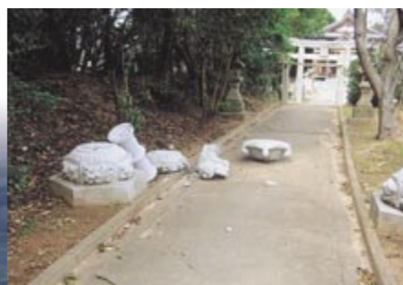
震度6弱の地震で倒壊し、バラバラに崩れ落ちた石灯籠 (福岡市東区の和都美神社)

さて、家のドアを開けると、並べていたガラスビンや泥人形などが転落、積み場もない状態でした。古賀市の歴史資料館も気になり電話しますが通じません。もちろん、この時点で同資料館も被害を受けていましたが、幸い、文化財専門委