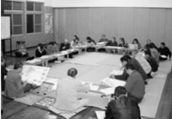
第1回 小山田まちづくり委員会の様子