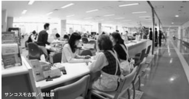
サンコスモ古賀/福祉課

【性別役割分担】 役割(社会的地位に付随した行動様式)が性別に区分され、それぞれが生物学的男女によって担われる状態をいいます。出産とそれに伴った育児や生活維持役割が女性役割。これに対し、男性役割は生産活動の担い手、家族の養い手と位置付けられています。日本では、女性の労働市場への参加が進んでも性別役割分担の解消は進まず、かえって「夫は仕事、妻は家庭と仕事」の新・性別役割分担が一般化してきています。