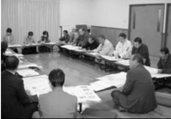
第2回 米多比まちづくり委員会の様子

今回は、地域の土地利用の将来を考える「まちづくり委員会」の進み具合について紹介します。