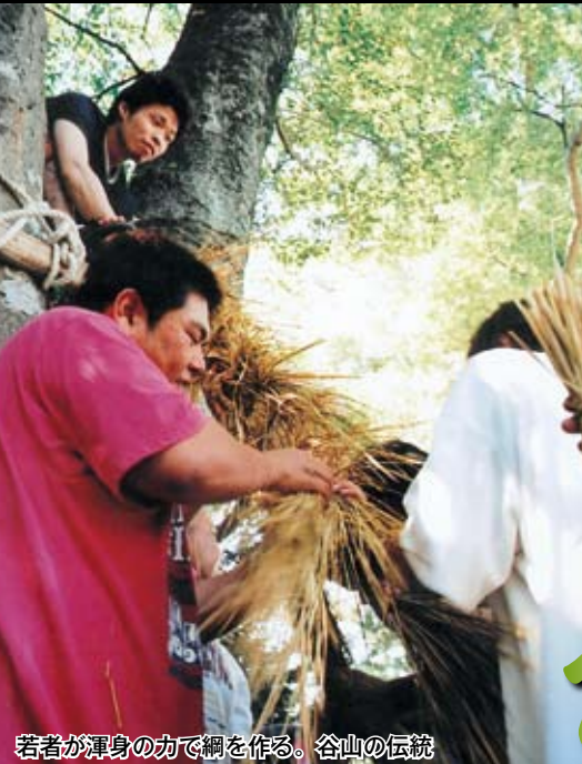
若者が渾身の力で網を作る。谷山の伝統