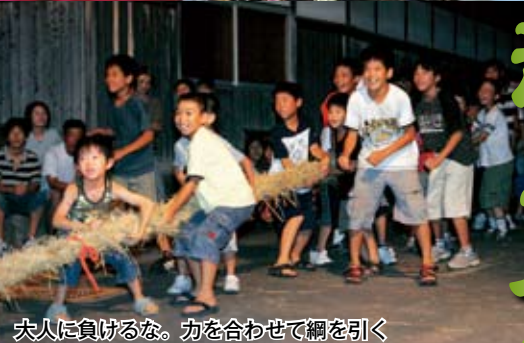
大人に負けるな。力を合わせて網を引く