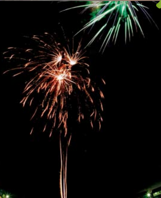
舞の里地区初の合同夏祭りを祝う大花火