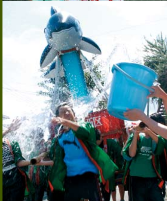
久保西子どもまつりは今年で11年目を迎えた