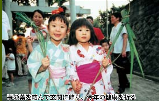
茅の葉を結んで玄関に飾り、今年の健康を祈る