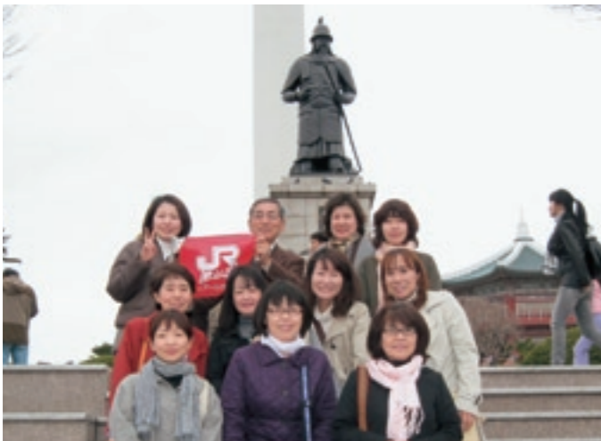
第5期生で韓国釜山へ「突撃実践旅行」を敢行

これまでりんぽ・かんの異文化教室で学ばれてきた諸先輩方に習って、私たち第5期生も当然のように自主グループとして今後も韓国文化教室を続けていきたいと考えています。