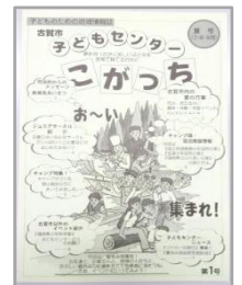
こがっち第 1 号

平成 11 年 7 月から発行を始めた「こがっち」は、次号で 100 号を迎えます！ これからも「こがっち」は、子どものための情報誌として情報を届けていきます。 そこで、「こがっち」に掲載してほしいことや、新コーナーの「企画」を募集します。 たくさんのご応募をお待ちしています！