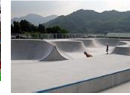
スケートパーク ※小学生以下保護者同伴