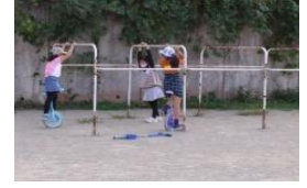
小野っ子ゆうゆう広場のようす (10/13開所)