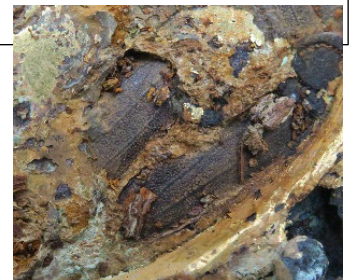
玉虫の翅の アップ写真