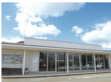
地域の拠点・公民館

成人学級・子ども会育成会・福祉会はもちろん、あけぼの会(シニアクラブ)・ダンスクラブ・野菜クラブなどの活動や、健康づくりを兼ねた防犯パトロール活動が盛んです。最近では、介護予防を目的とした鍵盤ハーモニカや、多世代の健康づくりをめざすヘルス・ステーションの活動も始まっています。