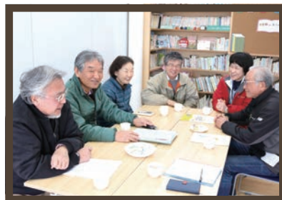
健康づくりをめざす会議は笑顔で

歩圏内にはないことから、地域の仲間で楽しく笑顔でうどん作りとそのお食事を楽しめる場を…ということで続いています。