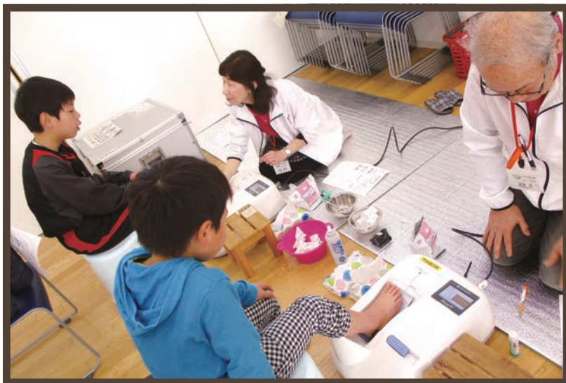
子どもたちと一緒に健康測定会へ