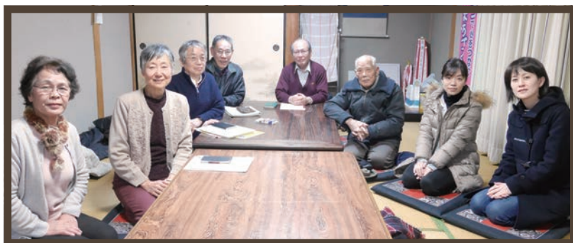
ヘルス・ステーションの役員のみなさん

らう機会があり、家族全体の健康づくりを意識できた」「子どもが家と学校以外の居場所を見つけることができそうだ」といった声がありました。