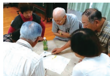
事例学習もしっかり

参加者からの質問や要望に向き合いながら、健康づくりを志す、同じ地域で暮らす住民同士で工夫を楽しく重ねていく中川区の活動が、これからも楽しみです。