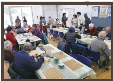
月に2回のうどん屋さん