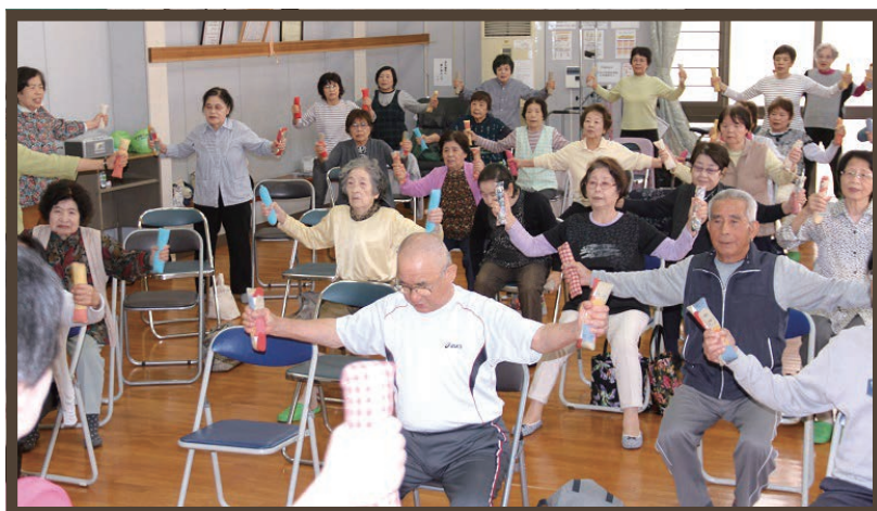
福祉会による二ギ二ギ体操の様子