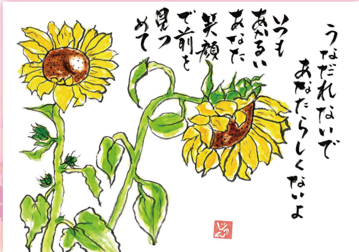
▲ たけした じゅんこ 竹下 順子さんの作品