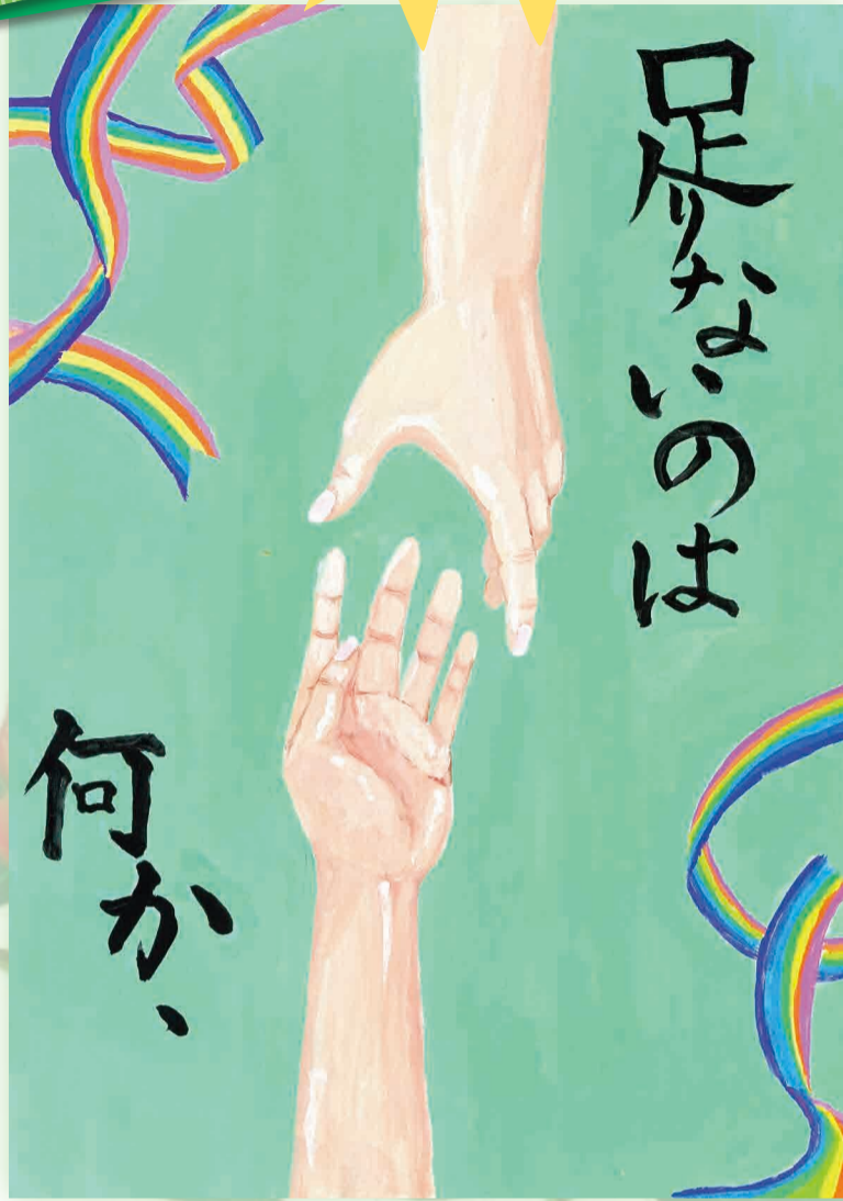
古賀市立古賀北中学校 2年6組