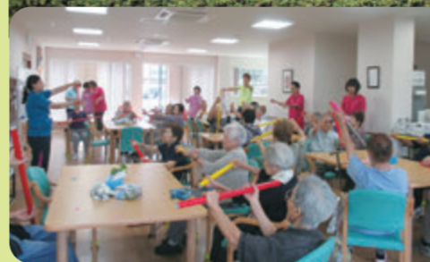
▲デイサービスの様子