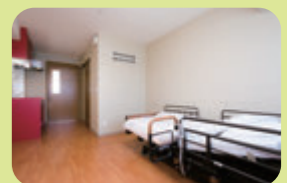
▲広々とした綺麗な居室