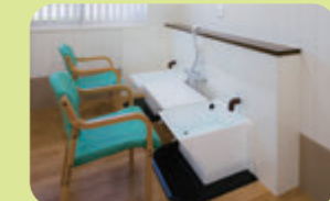
▲炭酸泉の足湯設備