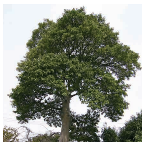
市の木 「クロガネモチ」